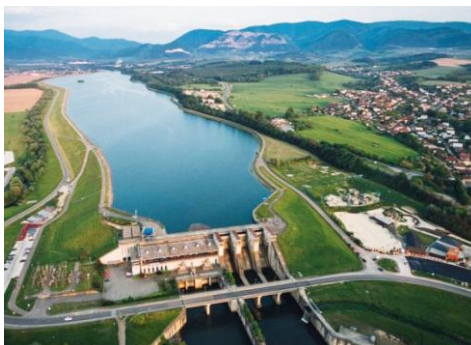
Vodné dielo Žilina je najmladšia priehrada na Váhu.