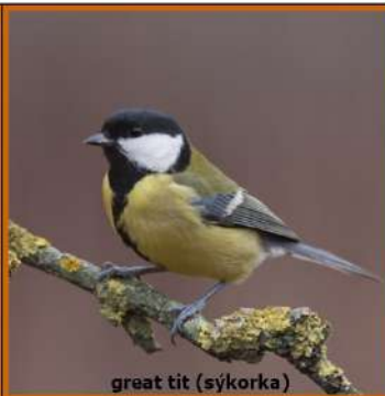
great tit (sýkorka)