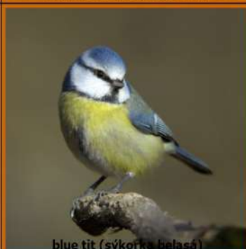
blue tit (sýkorka belasá)