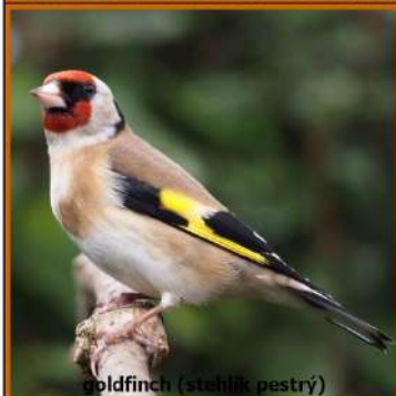
goldfinch (stehlík pestrý)