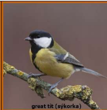
great tit (sýkorka)