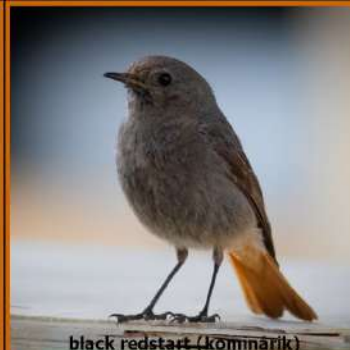
black redstart (kômnárik)