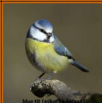
blue tit (sýkorka belasá)