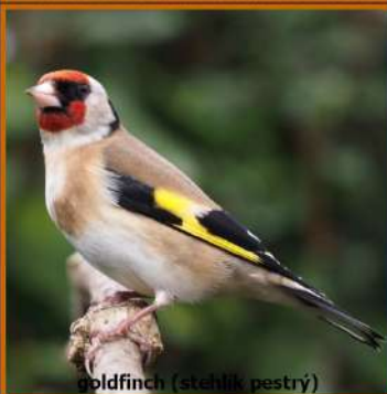
goldfinch (stehlík pestrý)