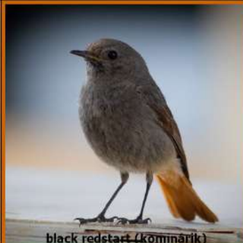
black redstart (kômnárik)