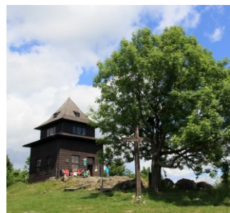
SITNO (pri B. Štiavnici)