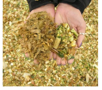
SILÁŽ (pre zvieratá)