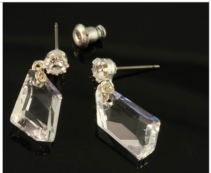
Náušnice so Swarovského krištálmi.