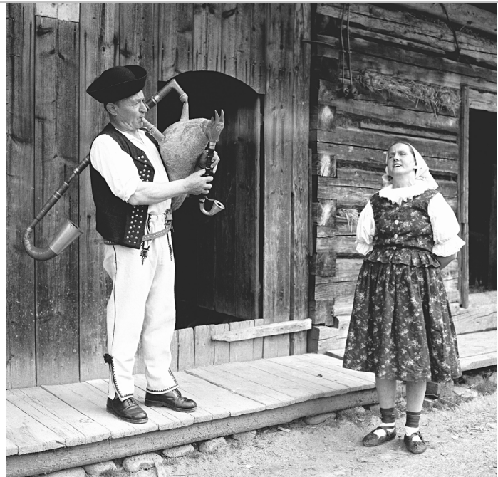
krištalový hlas/ zvuk