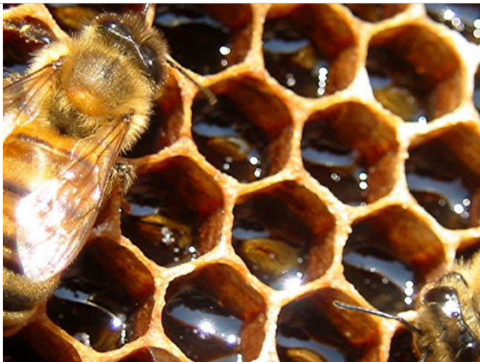
med v pláste