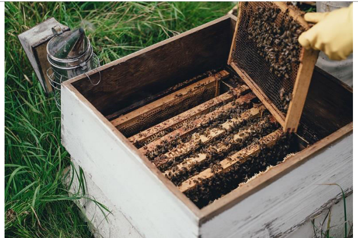
včelí úl' (vnútro)